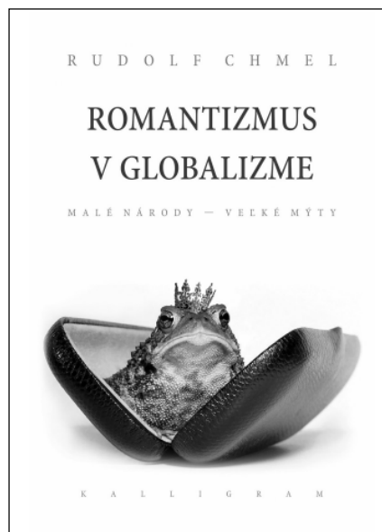
Rudolf Chmel Romantizmus v globalizme Malé národy – veľké mýty

Kniha literárneho vedca Rudolfa Chmela prezentuje výsledky podstatnej časti jeho aktivít posledných štyroch desaťročí v oblasti literárnej histórie, skúmania slovensko-maďarských vzťahov i širšieho stredo-európskeho historického kontextu, ale aj verejného pôsobenia v diplomatickej, politickej sfére či angažovanosti v mimovládnom sektore. Texty v nej zahrnuté – štúdie, eseje, rozhovory – nastoľujú otázky zmyslu našich dejín, národnej identity od romantizmu po dnešok, charakterizovaný nielen prirodzeným integračným úsilím, ale i problémami globalizmu. Na pozadí mnohostrannej reflexie slovenskej identity – literárnej, kultúrnej, politickej – sa v nej tak zrkadlí vyše poldruhistoročný vývoj slovenskej otázky od romantizmu po globálny dnešok, v ktorom si Slovensko nachádza svoje historické aj aktuálne miesto.